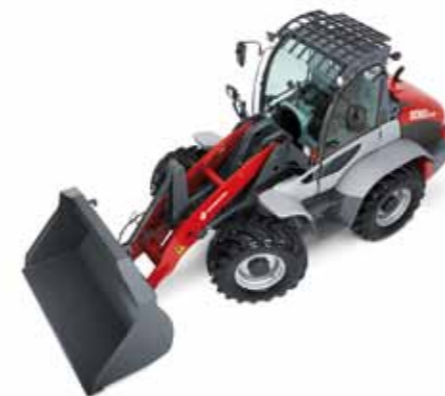
Рулевое управление передними колесами