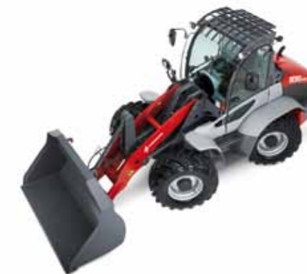
Рулевое управление с одновременным поворотом всех колес в одну сторону*