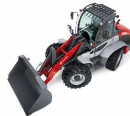
Рулевое управление со всеми управляемыми колесами